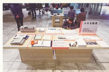
2015年度 としょかん・メディアテークフェスティバル 「ふれる読書、さく読書—バリアフリー資料展示」

主催:仙台市民図書館、せんだいメディアテーク(公益財団法人仙台市市民文化事業団)