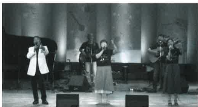
2019年コンサート風景